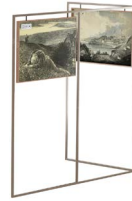
إطار معدني للجدار