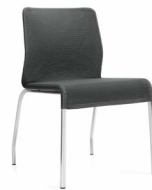
كرسي واحد لكل جناح